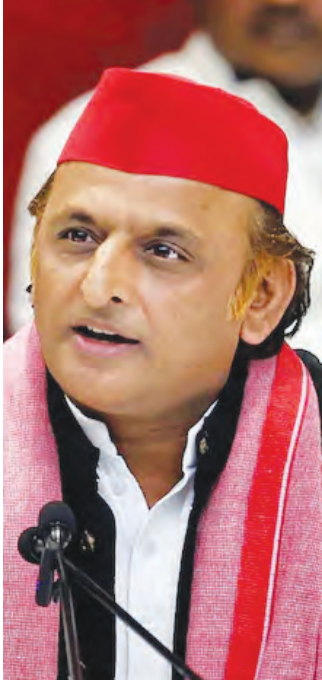
लखनऊ, 23 नवंबर (एजेंसियां)। मतदाता सूची के विशेष गहन पुनरीक्षण कार्यक्रम (एसआईआर) की सीरियस